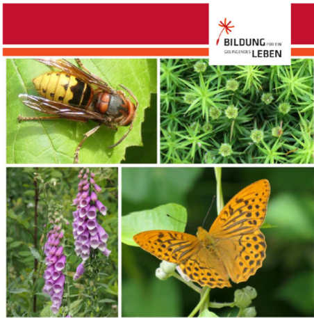
Kuckuck, Käfer, Kräuter - im Wald gibt´s mehr als Bäume